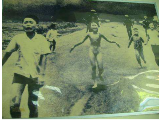
Photo: Kinder die flüchten, die Angst haben vor dem Krieg vor der Gewalt.