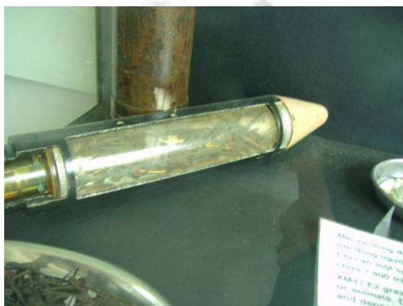
Photo: Die Splitterbombe. Obwohl die Genfer Konvention nach dem 2. Weltkrieg die Kriegsführungsmethoden regelte, wurde diese Splitterbombe vom Gründerland der UN Charta benützt. In Vietnam und Kambotscha. Von dem Land, welches im ständigen Sicherheitsrat ist!