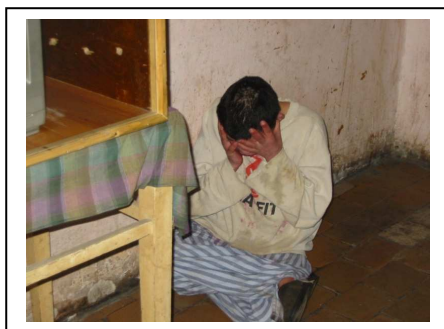
Dieser Mann auf dem Foto wurde durch ein Loch in der Türe fotografiert.

Viele Ukrainer sagen, es sind meistens Männer, die sich seinerzeit gegen das russische System aufgelehnt haben. Diese wurden dann einfach abgeschoben. Die Jüngeren sind wohl da, weil sie keine Familie haben. Das heisst, dass z.B. geistig Behinderte, wenn sie volljährig sind, in solche Heime wie Perecin gebracht werden und dann ihr ganzes Leben in diesem Heim verbringen.