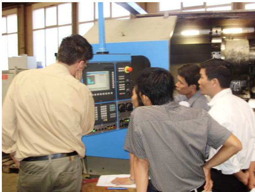
Photo: Bedenkt man, dass 3 Lehrer nur Vietnamesisch konnten, eine Lehrerin ganz wenig englisch, da geht es nur, wenn man alles zeigt, einfach zeigen. Aber es geht, da erkennt man schon das Sprichwort: Dass eigentlich die primitivste Art sich zu verständigen das reden ist! Obwohl, es braucht auch etwas Nerven!