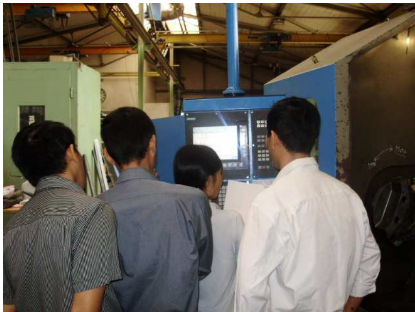
Photo: Hier lernt man mit Testlauf auch Zyklen zu programmieren