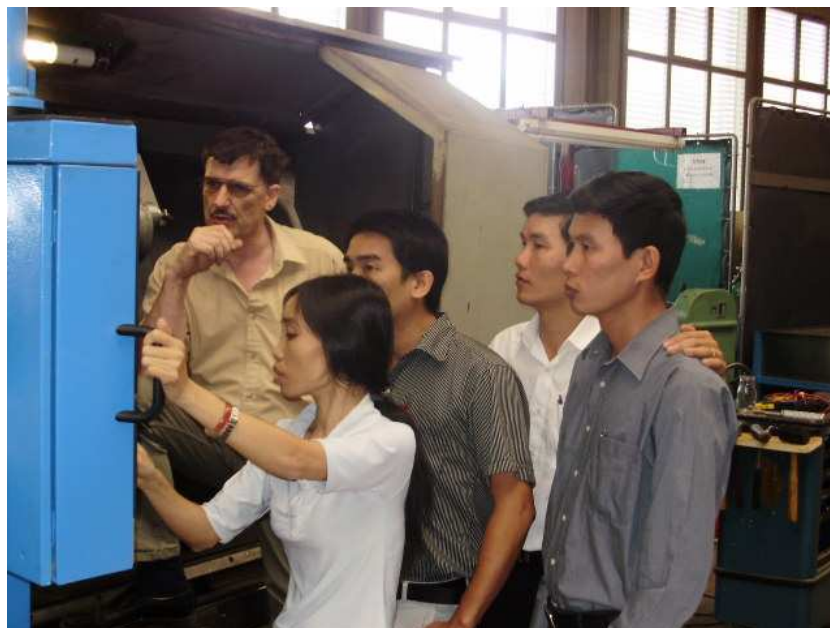
Photo: Einiges hat man getestet. Zyklen mit Kontur, Gewinde schneiden Bohren